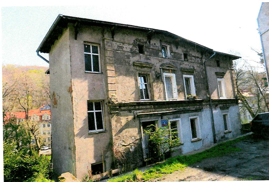
Fot. 1. Ogólny widok budynku.

W czasie badań ww. budynku nie stwierdzono potencjalnych miejsc rozrodczych dla nietoperzy, nie stwierdzono również samych zwierząt.