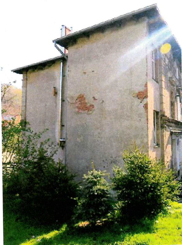
Fot. 2. Ogólny widok elewacji budynku.