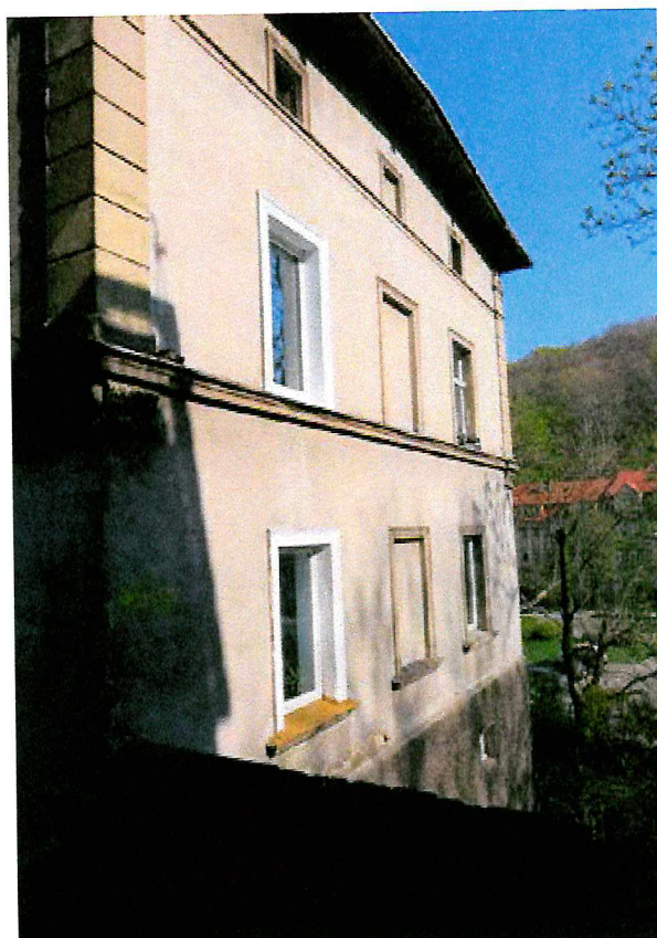
Fot. 3. Ogólny widok elewacji budynku.