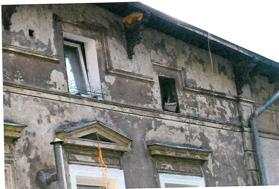
Fot. 4. Ogólny widok elewacji budynku.