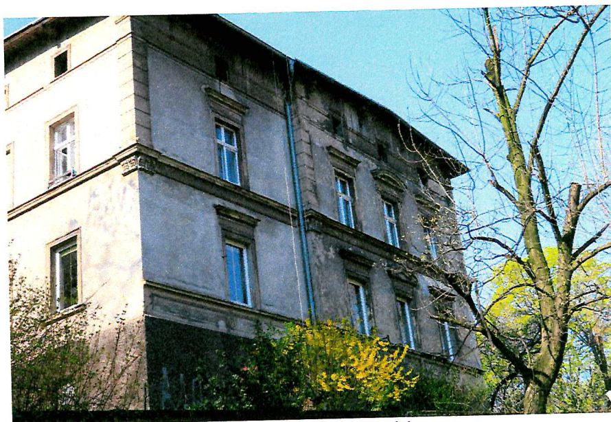
Fot. 5. Ogólny widok elewacji budynku - brak miejsc lęgowych ptaków.